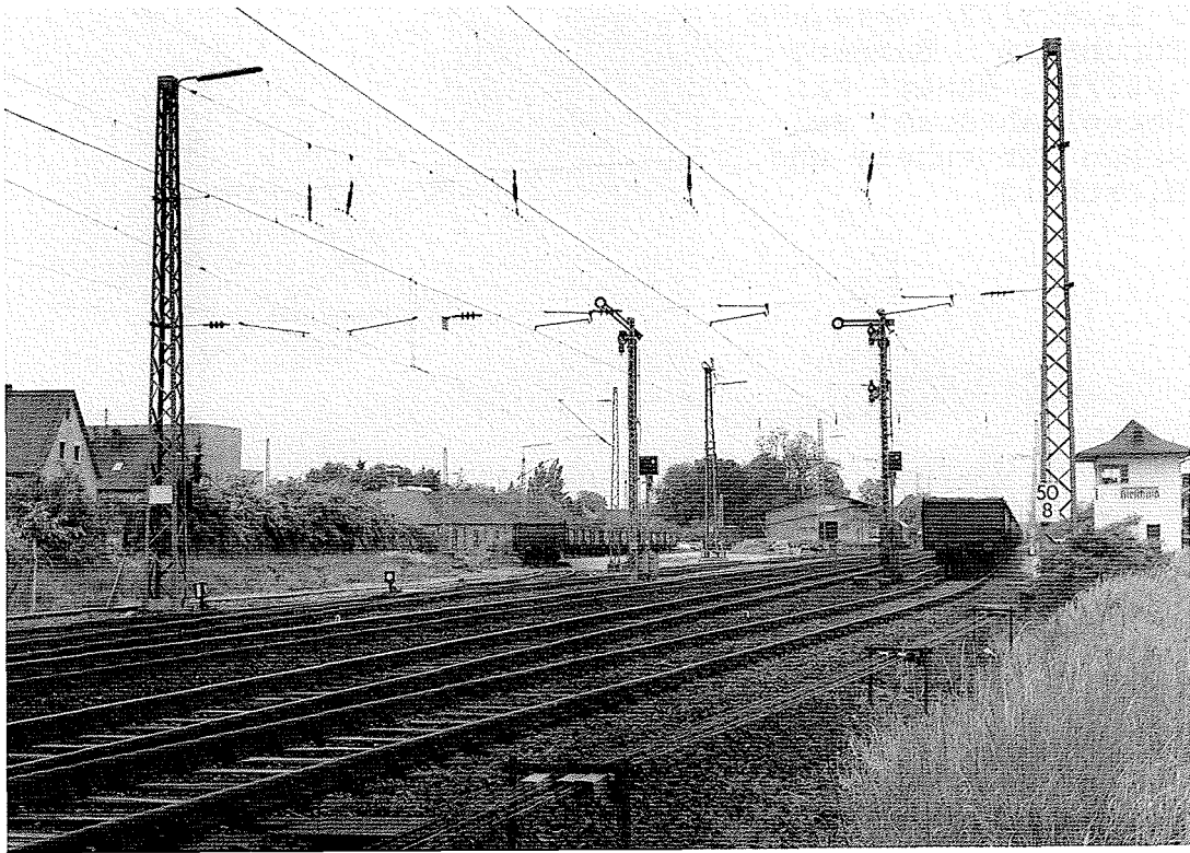
F 11.8.3./4 Versuche Forchheim - Bamberg 1963/64: verbesserte Regelfahrleitung 1950 im Quertragwerk des Bahnhofs Hirschaid [Schwach 1983]