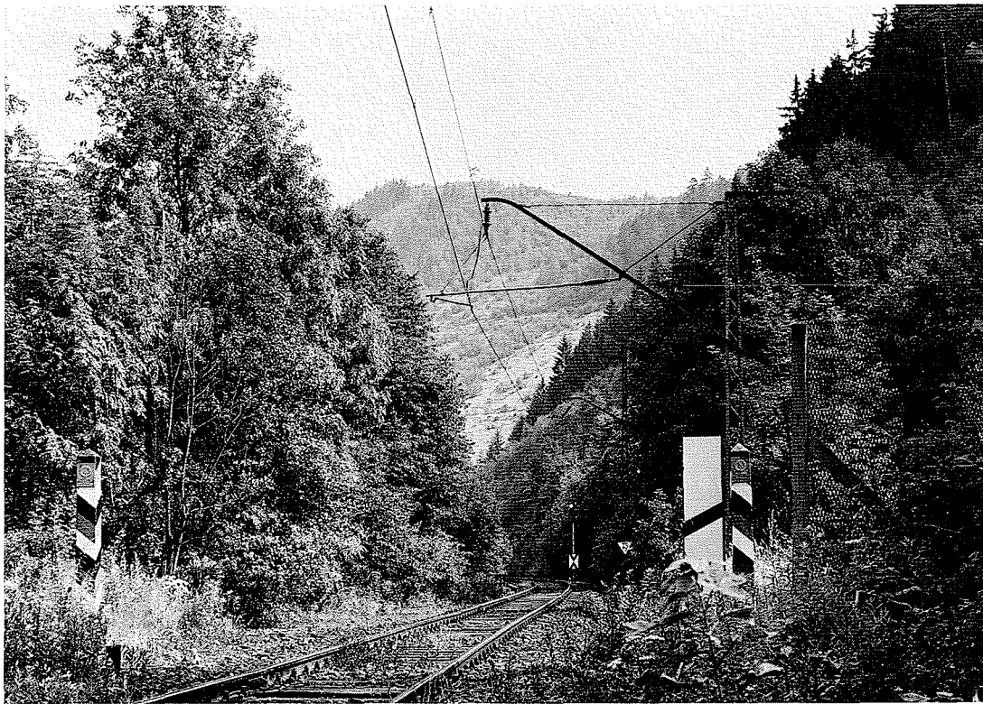
F 12.5./1 Erneute Elektrifizierung Probstzella - Rbd-Grenze bei Falkenstein 1950: Stützpunkt am Schrägausleger [Schwach 1985]