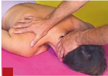
Figure 6 : Technique d'étirement neuromusculaire du muscle élévateur de l'omoplate droit