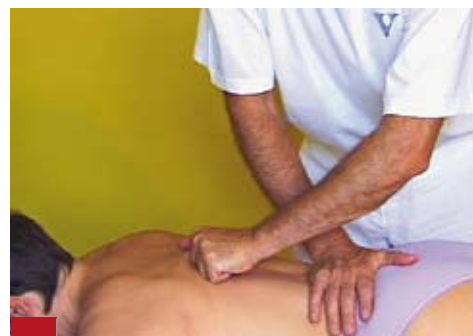
Figure 4 : Technique myofasciale des muscles érecteurs du tronc gauche