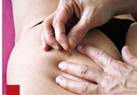
Figure 8 : Technique de puncture sèche au niveau du PTRM dans le muscle piriforme gauche