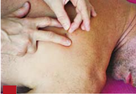
Figure 7 : Technique de puncture sèche au niveau du PTRM dans le muscle infra-épineux droit