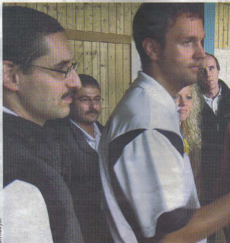
Les athlètes doivent être tangibles pour les spectateurs.

par l'athlète doit être visualisée pour les spectateurs. Il s'agit en l'occurrence de la capacité de maintien de l'arme. En la rendant visible, le public peut constater l'impact sur la cible lors d'un départ du coup impeccable. Cela provoque un effet de surprise si le coup est profond malgré une grande zone de pointage ou si le coup est mauvais malgré une petite zone de pointage parce qu'il a été arraché.